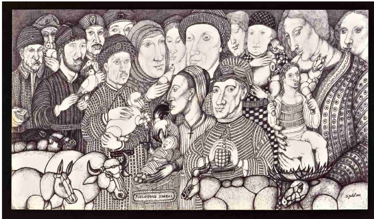
Jacic Vojislav, «L'adoration des Mages», 1993, stylo à bille sur papier, 40 x 70 cm. (Collection de l'art brut, Lausanne/Pro Litteris/photo: Kevin Seisdedos,