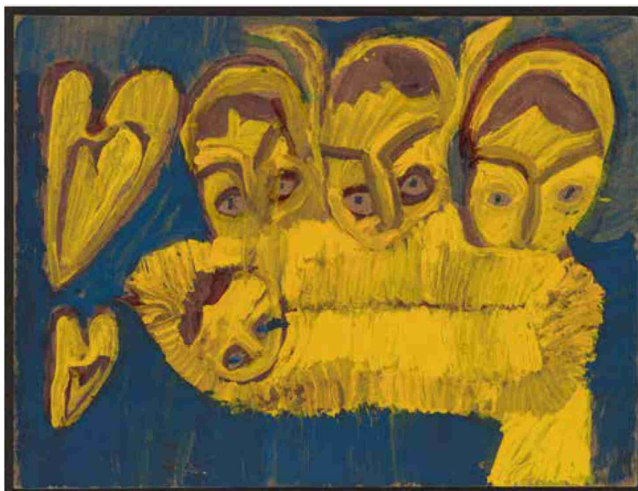
Maria Wnek, «Sans titre», entre 1990 et 1996, gouache sur pavatex, 20 x 40 cm. (Collection de l'art brut, Lausanne/Pro Litteris/Photo: Claudine Garcia, Ville de Lausanne)

Un accrochage d'œuvres d'Aloïse - dont deux dessins ayant fait l'objet d'une donation en 2021 - est présenté dans une salle d'exposition de la Collection de l'art brut dès le 21 décembre 2021.