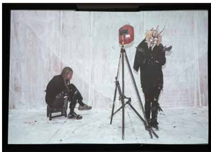
© Augustin Rebetez Sans titre, extrait de la projection, 2023

Les illustrations de l'exposition seront disponibles dès le jeudi 2 février à l'adresse suivante : https://fermedestilleuls.ch/presse/