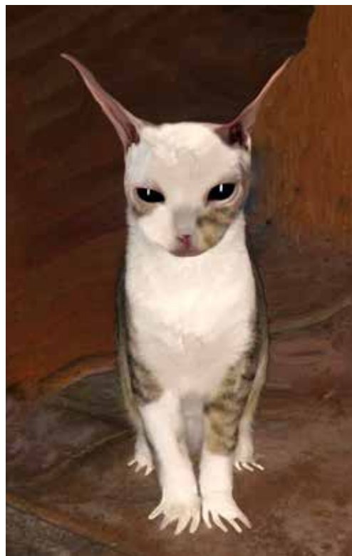
© Augustin Rebetez Sans titre, tiré de Very Charming Animals : Cats , 2023.