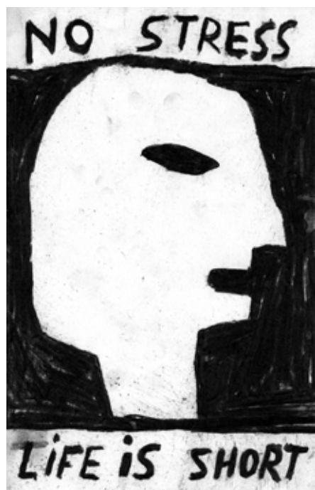
© Augustin Rebetez Sans titre, tiré de The Good Life : A Pratical Guide , 2023.