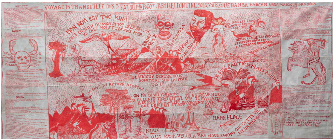
Voyage intranquille au pays du retour heureux , dessin à l'encre sur papier industriel, œuvre collective réalisée dans le quartier de la Médina pour la Biennale de l'Art africain contemporain, Dakar, 2022. © François Burland

Les illustrations de l'exposition seront disponibles dès le 6 février à l'adresse suivante : https://fermedestilleuls.ch/presse/