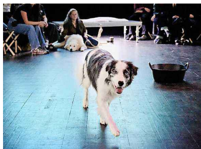
«In Bocca al Lupo», le 31 mai à La Neuveville (BE), est une création sur et autour des loups. Chloé Cohen

Nuithonie, jusqu'au sa 30 mai (20h). equilibre-nuithonie.ch