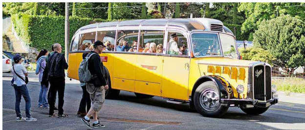
Les bus old-timer qui assurent gratuitement les transports: un incontournable de la Nuit des musées de la Riviera. Céline Michel

Ordre: 1094419 N° de thème: 862021 Référence: 73e55a04-9101-4e7d-97b3-2f2f44b82527 Coupure Page: 5/5